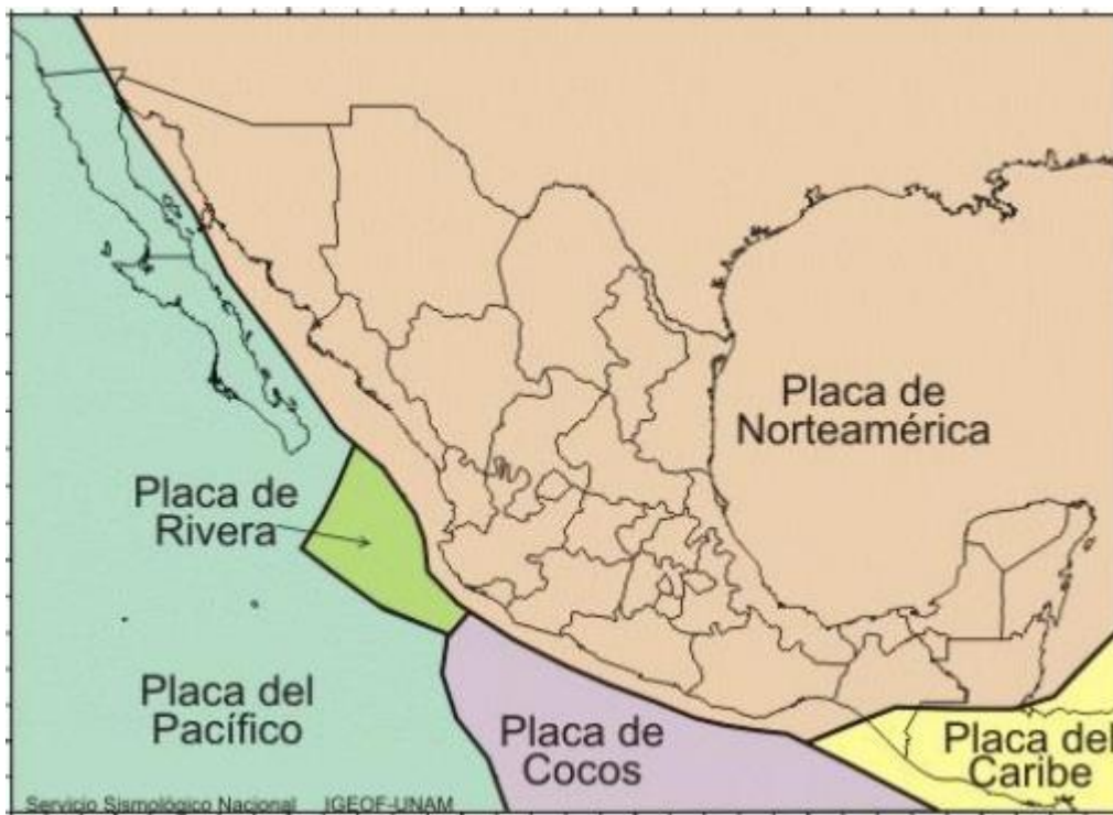
Ilustración 2: Placas tectónicas que interactúan en el territorio mexicano

El sismo del 3 de junio de 1932 es el sismo de mayor magnitud que ha sido registrado en la era instrumentada de México. Además de los terremotos de 1932, otros sismos importantes han ocurrido a lo largo de la costa de Colima-Jalisco, como consecuencia de la subducción de las placas Rivera y Cocos por debajo de la placa de Norteamérica.