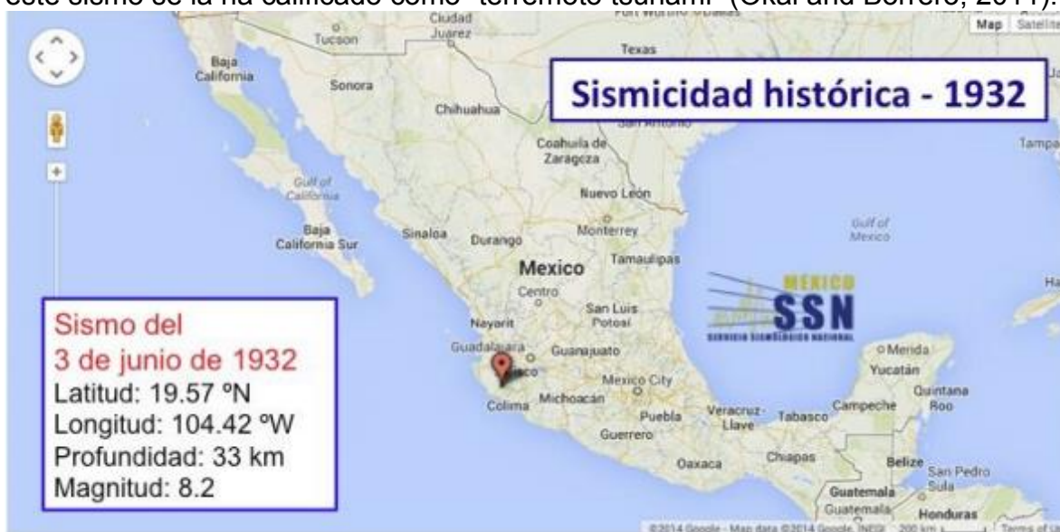
Ilustración 1: Epicentro del sismo del 3 de Junio de 1932

El día 3 de junio de 1932 ocurrió un sismo con magnitud 8.2 localizado en las costas de Colima-Jalisco (19,5 N, 104.25 W). A este sismo le siguieron otros dos de magnitud 7.8 y 6.9 los días 18 y 22 de junio del mismo año. Estos sismos han sido ubicados en la interfase entre las placas de Rivera y Norteamérica. Este último sismo, el del 22 de junio, generó un tsunami más devastador que el del sismo principal a pesar de que la magnitud sísmica fue mucho más pequeña. A este sismo se la ha calificado como “terremoto tsunami” (Okal and Borrero, 2011).